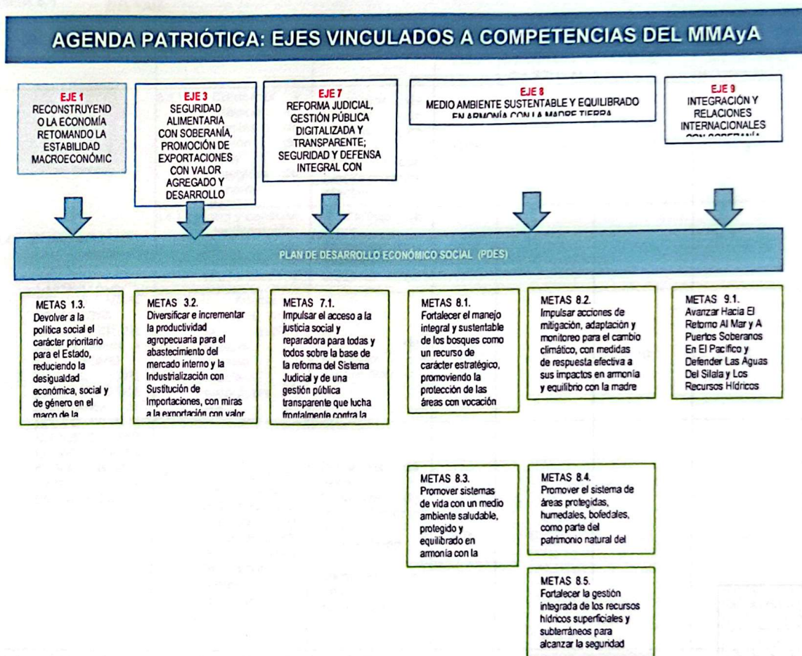
Figura 1.- Contribución Directa del PSDI – MMAyA a la Agenda Patriótica.

Contribución Directa del PSDI-MMAyA al PDES, participa en 3 pilares de la AP2025, específicamente en el Pilar 2, universalización en el acceso a los servicios básicos, Pilar 6 vinculado a riego y bosques desde el enfoque de contribución a la soberanía productiva y al Pilar 9, soberanía ambiental con desarrollo integral que aborda el fortalecimiento de la gestión del agua, bosques, biodiversidad, áreas protegidas, cambio climático, gestión de calidad ambiental y gestión integral de residuos sólidos, como se muestra en la siguiente figura.